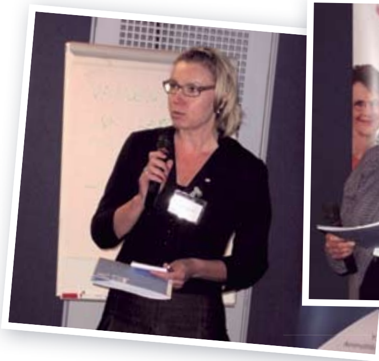
Sole Noranta SPR:n keskustuimistolta kertoi näkemyksiään.

Järjestäjien puolesta lausumme kiitossanat kaikille risteilylle osallistuneille. Saamamme palautteen perusteella kehitämme YSTEAn luottamusmiesten tukemista vastaamaan entistä paremmin juuri teidän tarpeitanne. Kiitos ja kumarrus!