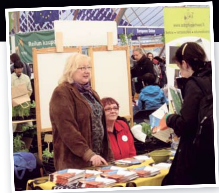
Kävijöitä kiinnostivat mm. Ystean rooli ja tehtävät.

Kepan järjestämissä paneelikeskusteluissa pohdittiin muun muassa Suomen ratkaisuja maailman köyhyyteen. Köyhyyden vähentäminen, kehitysmaiden omien pyrkimysten tukeminen sekä yhteiskunnallisen tasa-arvon ja ihmisoikeuksien edistämi-