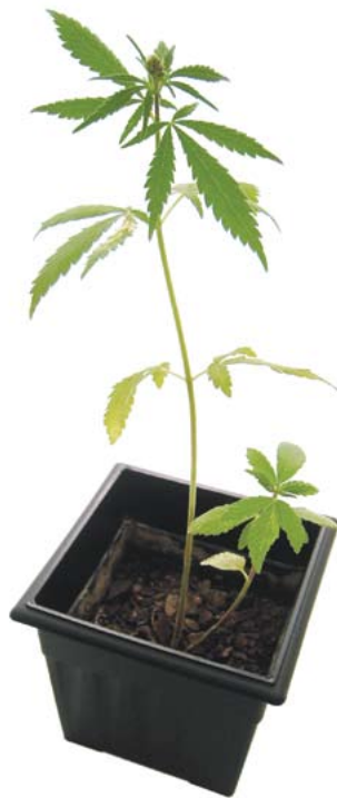
Kannabis on maailman yleisin laiton päihde.