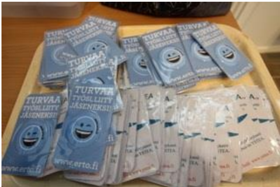
Kevätkokouksen saapuneet saivat ERTOn kännykän näytönpuhdistajan.

Esitetään hyväksyttäväksi YSTEAn kevätkokouksessa 20.5.2017