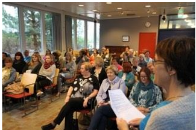
Yhteistyössä on voimaa.